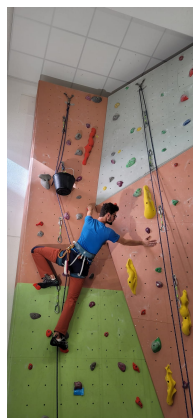
15 voies ont été notées étant à