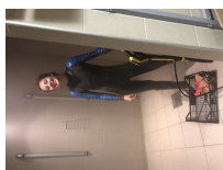
En plus du reportage sur le site, nous te préparons un superbe album