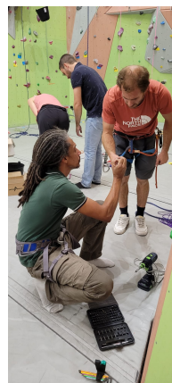
Les nouvelles voies